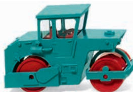
0650 05 Straßenwalze (ABG)