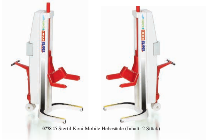
0778 45 Stertil Koni Mobile Hebesäule (Inhalt: 2 Stück)