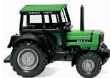
0386 02 Deutz-Fahr DX 4.70