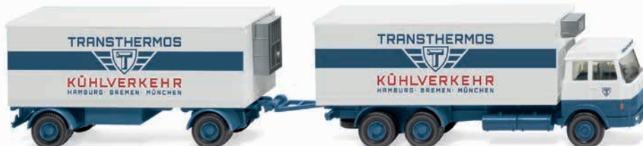
0440 01 Kühlkofferlastzug (Hanomag Henschel)