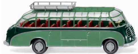
0730 02 Reisebus (Setra S8)