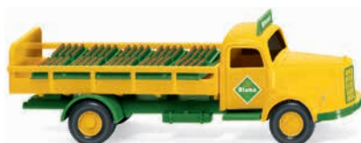
0570 02 Getränke-Lkw (MB L 3500)