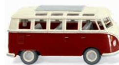
0797 22 VW T1 Sambabus