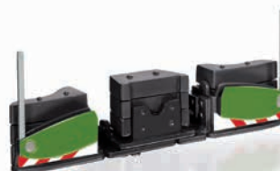
0778 43 AGRIBumper John Deere Design

D ie Sicherheit in der Landwirtschaft hat einen neuen Namen: Mit dem AGRIBumper kann die allgemeine Verkehrssicherheit von Schleppern auf Antrieb erhöht werden, weil im Fall einer Kollision insbesondere mit Pkw die Überlebenschancen der Insassen deutlich erhöht und sogar schwere Verletzungen anderer Verkehrsteilnehmer abgewendet werden können. Tatsächlich übernimmt der AGRIBumper die Funktion einer Stoßstange, gleichsam als Unterfahrschutz. WIKING hat den AGRIBumper so miniaturisiert, dass er an die