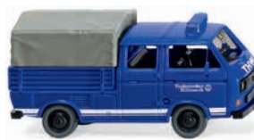
0293 07 THW - VW T3 Doppelkabine