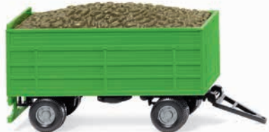
0388 15 Rübenanhänger