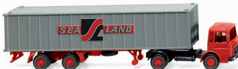
0523 04 Containersattelzug (MAN)