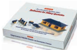
0990 94 Set "ASG"