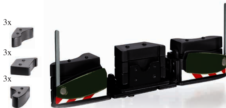
0778 44 AGRIBumper schwarz