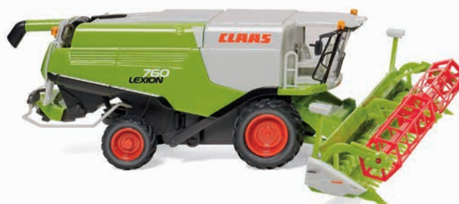
0389 14 Claas Lexion 760 Mährescher mit V 1050 Getreidevorsatz

Modellhistorie aus fünf Jahrzehnten präsentiert WIKING zum Ausklang des Programmjahres 2018: So fahren das VW Karmann Ghia Coupé als "Gelb-Schwarzer Renner", aber auch das Glas Goggomobil sowie der Opel Caravan '57 ins Programm. Dem traditionsreichen Modelltrio der 1950er- und 1960er-Jahre hat WIKING ein aufwändiges Finishing gewidmet – der Opel Freizeitkombi überrascht mit zweifarbiger Flankengestaltung sowie einem zeit-