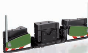
0778 42 AGRIBumper Fendt Design