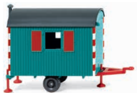
0656 07 Bauwagen