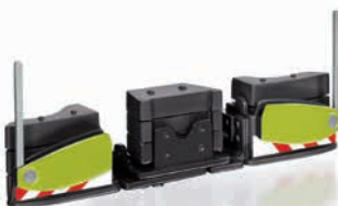
0778 41 AGRIBumper Claas Design