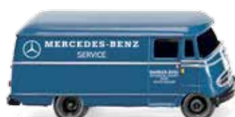
0265 02 Kastenwagen (MB L 319)