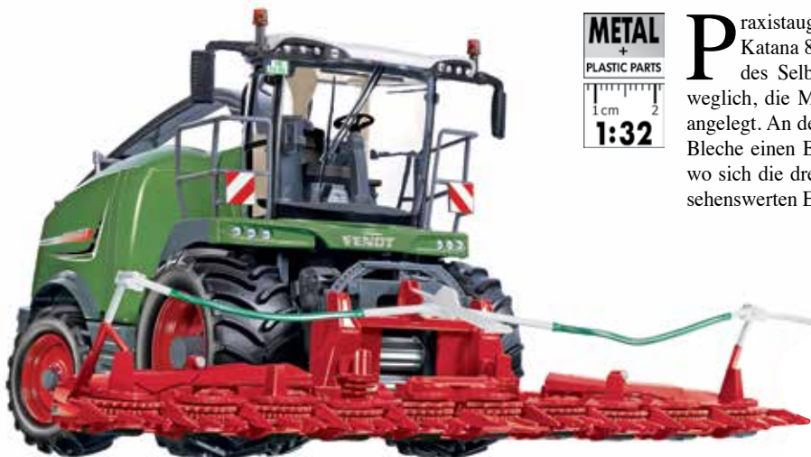
0778 13 Fendt Katana 85 Feldhäcksler