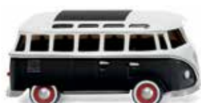
0317 03 VW T1 Sambabus