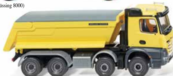
0674 49 Muldenkipper (Meiller/MB Arocs)