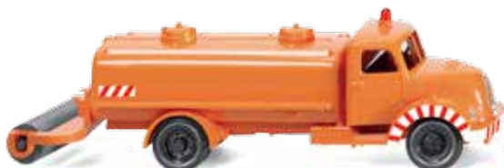
0640 01 Kommunal – Sprengwagen (Magirus Sirius)