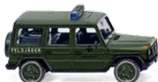
0695 07 Bundeswehr - Feldjäger (MB G)