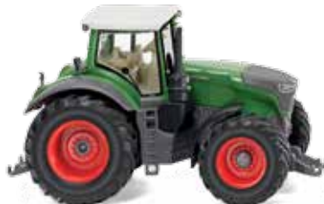
0361 60 Fendt 1050 Vario