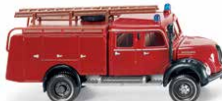
0863 38 Feuerwehr - TLF 16 (Magirus)