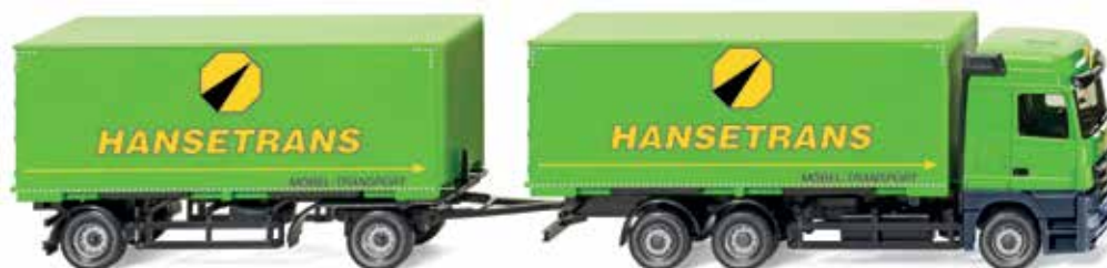
0573 11 Wechselkoffelhängerzug (MB Actros)