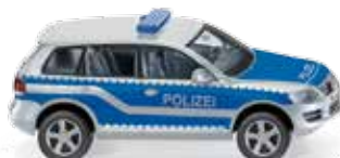
0104 49 Polizei – VW Touareg GP