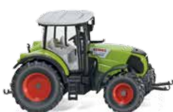
0363 10 Claas Arion 640