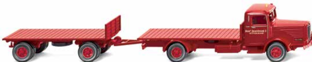
0856 01 Flachpritschenlastzug (Büssing 8000)