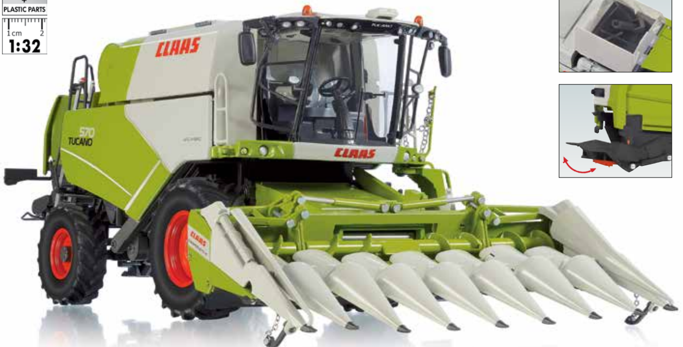
0778 18 Claas Tucano 570 Mähdrescher mit Maisvorsatz Conspeed 8-75