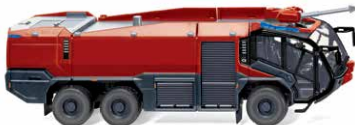
0626 49 Feuerwehr – Rosenbauer FLF Panther 6x6 (2015)

Zwei topaktuelle Schlepper beleben 2016 die landwirtschaftliche WIKING-Szenerie: Der Claas Arion 640 und der Fendt 1050 Vario. Auch der Baustellen-Spezialist des Mercedes-Benz Arocs und der neue Rosenbauer Panther 6x6 überzeugen mit funktionaler Detailkraft. Das Vorbild des neuesten Löschgiganten wird in den nächsten Jahren auf den internationalen Airports stationiert. Hoheitliche Ehre gibt sich indes der VW Touareg