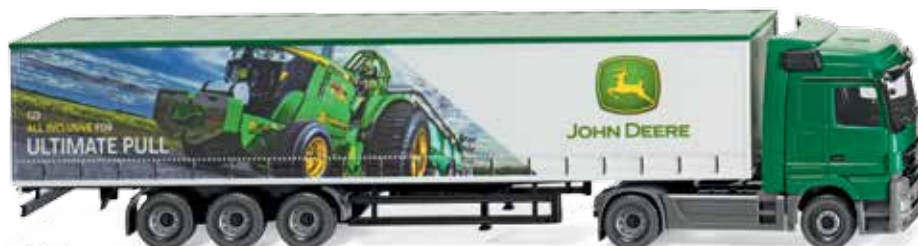
0537 08 Gardinenplanensattelzug (MB Actros)