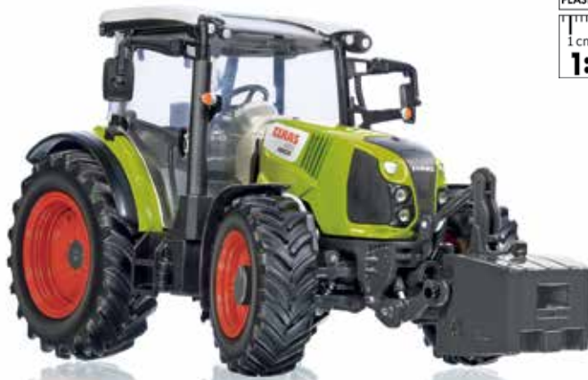
0778 11 Claas Arion 420