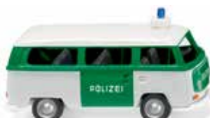
0864 39 Polizei - VW T2 Bus