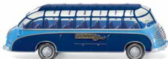
0730 01 Reisebus (Setra S8)