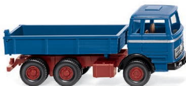
0424 07 Flachpritschenkipper (MB) Kubischer Youngtimer im Baustellen-Einsatz UVP 15,99 € · 1971-74