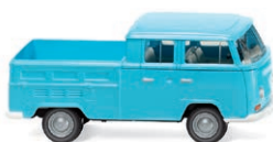
0314 04 VW T2 Doppelkabine Lastenträger des Baustellen-Trupps UVP 17,99 € · 1967-71