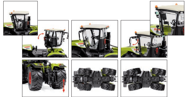
0778 53 Claas Xerion 4500 Radantrieb Schweres für den Landwirt leicht gemacht UVP 99,95 €