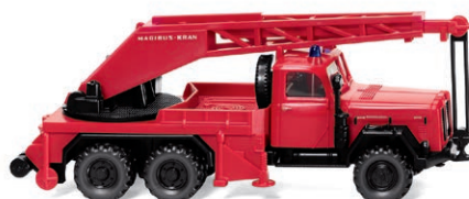
0861 49 Feuerwehr – Kranwagen KW 15 (Magirus Uranus) Berufsfeuerwehr-Gigant für schwere Aufgaben UVP 19,49 € · 1957-71