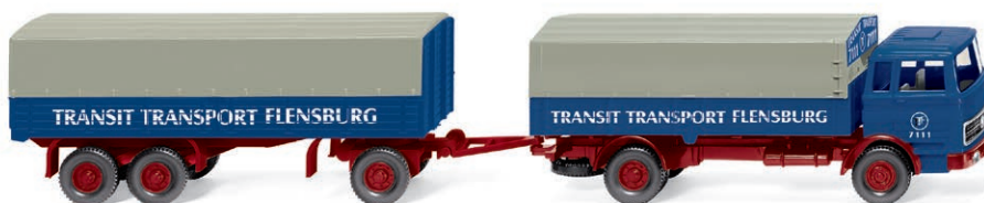
0432 03 Pritschenhängerzug (MB) Norddeutscher Logistik-Youngtimer UVP 31,99 € · 1972-73