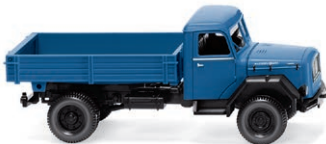
0424 99 Pritschenkipper (Magirus) Wendiger Baustellen-Eckhauber aus neuen Formen UVP 21,49 € · 1962-68