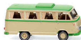
0270 44 Borgward Campingbus B611 Camper-Klassiker im Wirtschaftswunder UVP 16,99 € · 1957-61