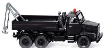
0634 09 Abschleppwagen (Volvo N10) Früher WIKING-Entwurf erstmals in Serie UVP 19,99 € · 1973-85