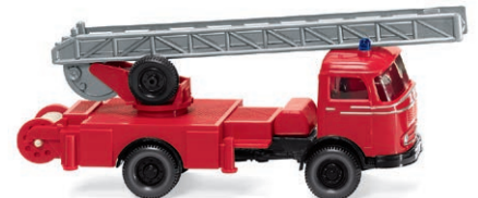
0861 48 Feuerwehr – Drehleiter (MB) Seltene Frontlenker-Drehleiter UVP 18,99 € · 1957-69