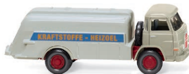
0781 02 Tankwagen (MAN) Premiere des Heizöltankers der Sechziger UVP 16,99 € · 1960-67