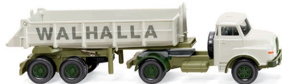
0677 07 Hinterkipper-Sattelzug (MAN) Auf dem Weg vom Steinbruch zum Kalkwerk UVP 22,99 € · 1969-94