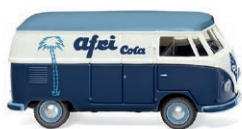
0788 17 VW T1 (Typ 2) Kastenwagen So machte Nachkriegsbrause mobil UVP 17,49 € · 1950-53