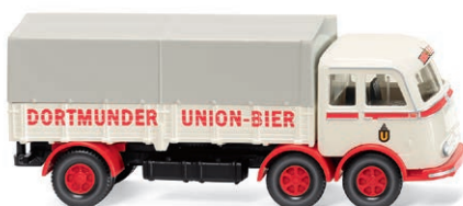
0429 03 Pritschen-Lkw (MB LP 333) Dortmunder Langstrecken-Bierkutscher UVP 21,99 € · 1958-61