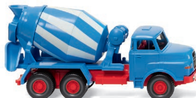
0682 08 Betonmischer (MAN) Baustellen-Hauber mit imposantem Auftritt UVP 21,99 € · 1969-94