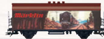
45901 Märklin-Katalogwagen 1930 – Nutzen Sie bitte zum Wechsel den Gleichstromradsatz E32376004