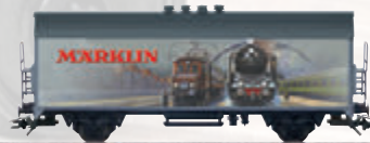
45900 Märklin-Katalogwagen 1929 – Nutzen Sie bitte zum Wechsel den Gleichstromradsatz E32376004