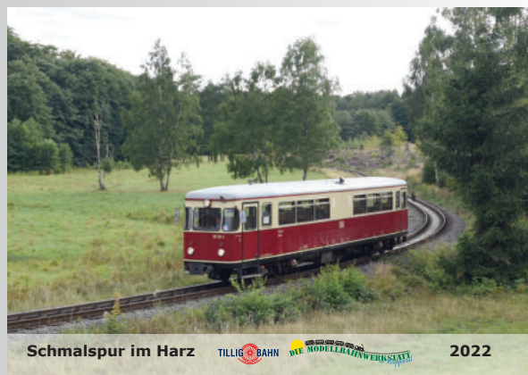
Schmalspur-Kalender 2022 Narrow-gauge calendar 2022