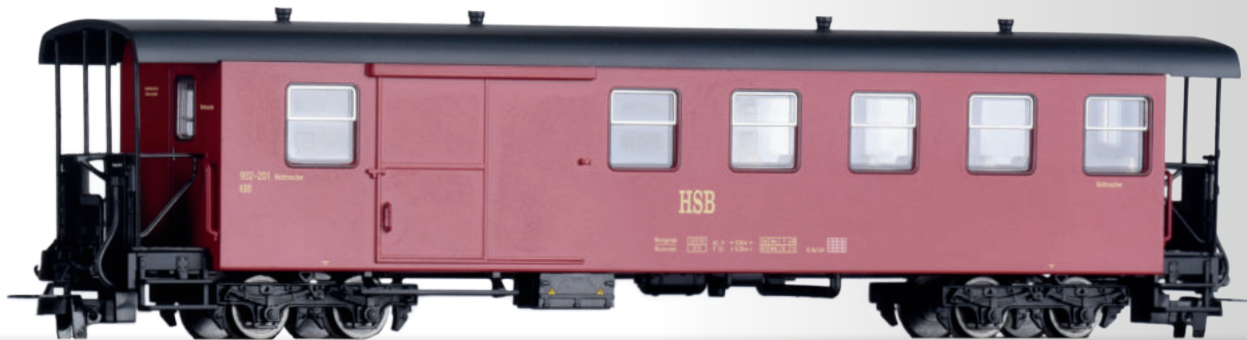
Packwagen KBD der HSB Baggage car KBD of the HSB