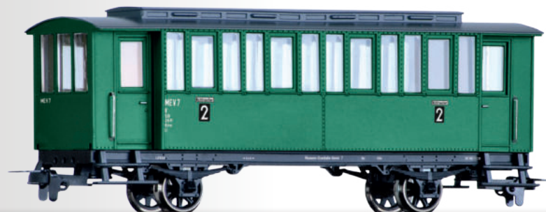
Personenwagenset einer Museumsbahn, bestehend aus drei Personenwagen Passenger coach set of the Museumsbahn with three passenger coaches