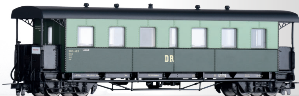
Personenwagen KB4ip „Harzer Roller“ der DR Passenger coach KB4ip „Harzer Roller“ of the DR • Ergänzung zu / Additional to 01174