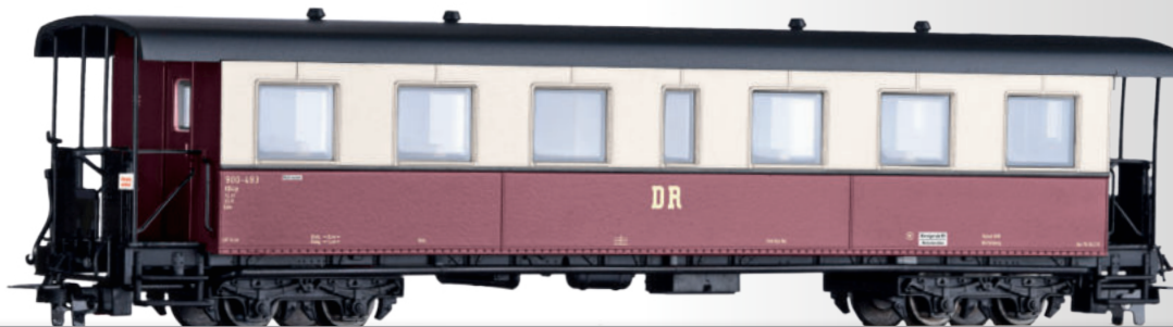
Personenwagen KB4ip der DR Passenger coach KB4ip of the DR