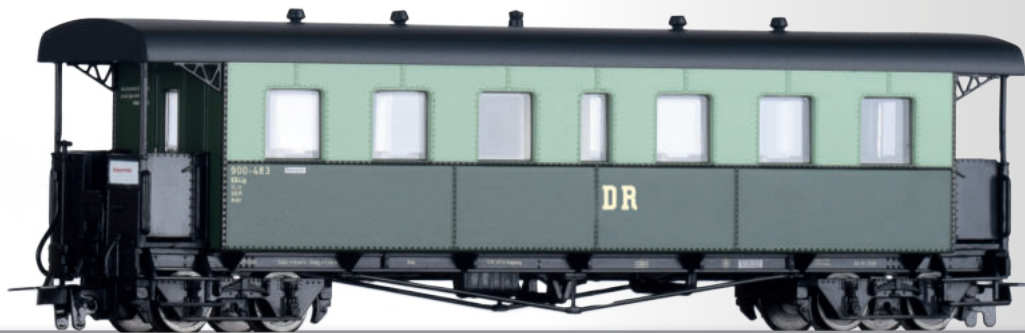
Personenwagen KB4ip „Harzer Roller“ der DR Passenger coach KB4ip „Harzer Roller“ of the DR • Ergänzung zu / Additional to 01174