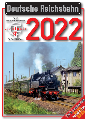
DR-Kalender 2022 DR calendar 2022 (Feuerleiben Verlag)