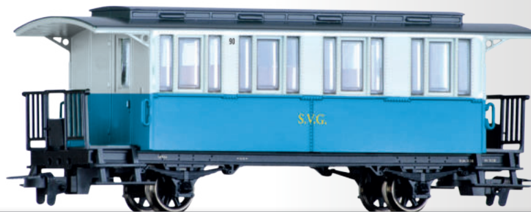
Personenwagen der Sylter Inselbahn Passenger coach of the Sylter Inselbahn