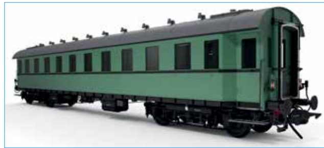
41251-03 3D-Zeichnung aus der Konstruktion