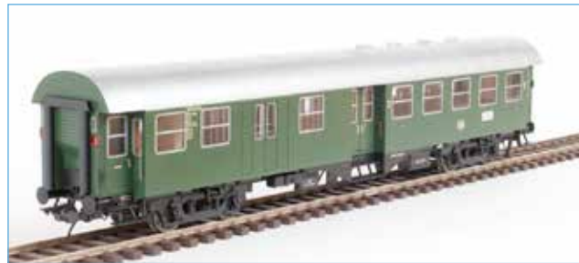
41230-04 Bild: Vorgängermodell