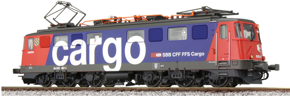
31532 , E-Lok, H0, AE6/6, 610 487-1 Langenthal, rot/blau, Ep. V, DC/AC