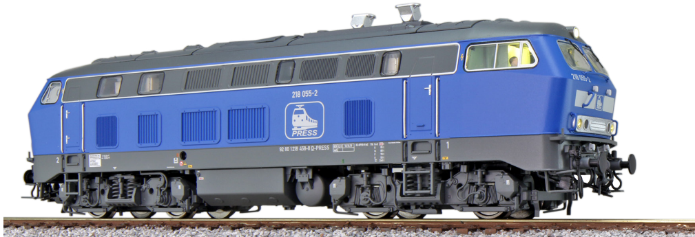
31009 , Diesellok, H0, BR 218, 218 055 Press, blau, Ep. VI, DC/AC