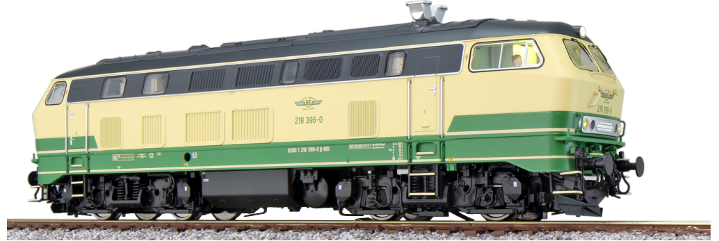
31008 , Diesellok, H0, BR 218, 218 396 Brohltalbahn, beige/grün, Ep. VI, DC/AC