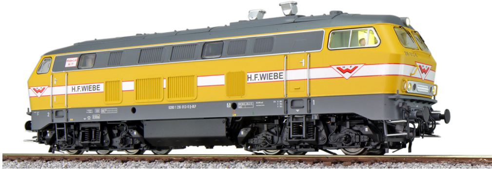
31003 , Diesellok, H0, BR 216, 216 012 Wiebe, gelb, Ep. VI, DC/AC