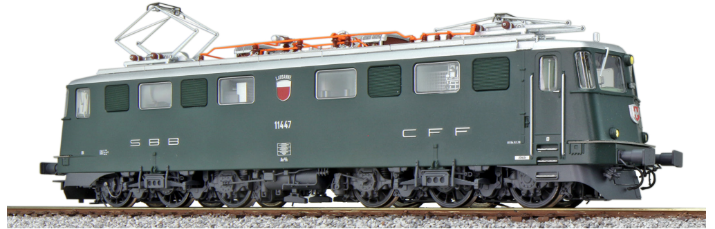
31536 , E-Lok, H0, AE6/6, 11447 Lausanne, grün, Ep. IV, DC/AC