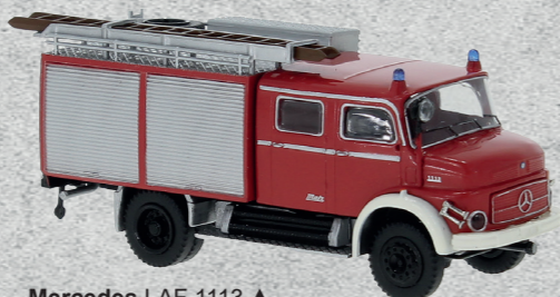
Mercedes LAF 1113 ▲ TLF 16, 1972 Nr. v 47170 35.95