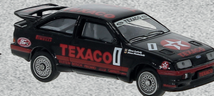
Ford Sierra RS 500 Cosworth, 1988 ▶ Nr. 19253 19,95