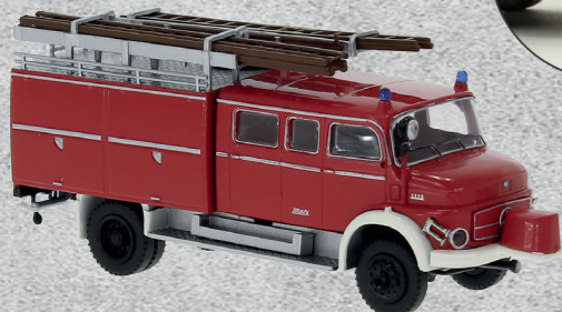
Mercedes LAF 1113 LF 16, mit Vorbaupumpe, 1972 Nr. v 47141 35.95