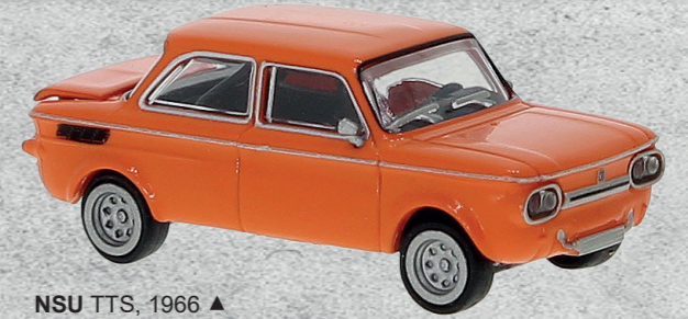
NSU TTS, 1966 ▲ Nr. 28251 15,95