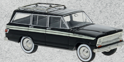
Jeep Wagoneer, Cherokee, 1968 ▶ Nr. v 19867 18,95