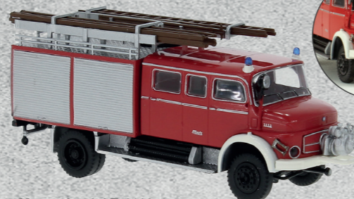
Mercedes LAF 1113 ▲ LF 16, 1972 Nr. v 47140 35.95