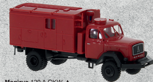
Magirus 120 A GKW ▲ Nr. v 46435 19.95