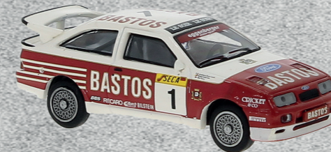
◀ Ford Sierra RS 500 Cosworth, 1989 Nr. 19254 19,95