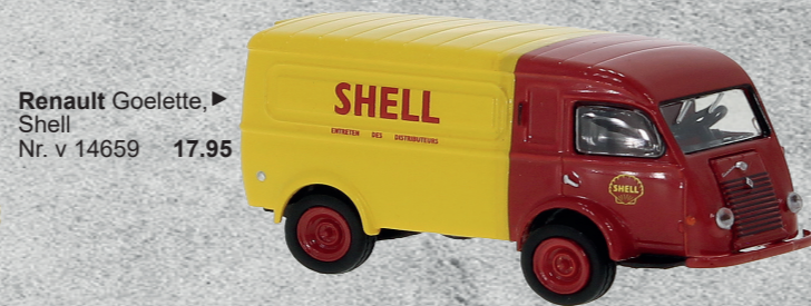
Renault Golette, Shell Nr. v 14659 17.95