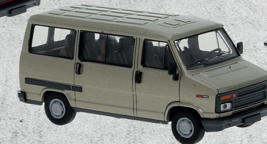
Citroen C25 Bus, 1982 ▶ Nr. 34906 18,95