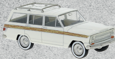
◀ Jeep Wagoneer B, Wooden Stripe, 1968 Nr. v 19870 18,95