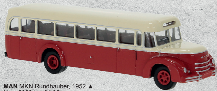
MAN MKN Rundhauber, 1952 ▲ Nr. n 59221 34.95