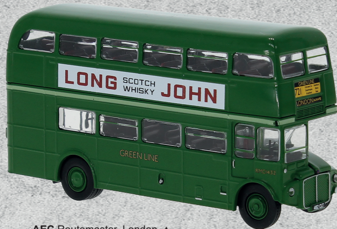
AEC Routemaster, London ▶ Greenline - Lohn John Whisky, 1965 Nr. v 61110 34,95