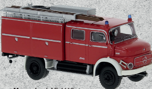
Mercedes LAF 1113 ▲ TLF 16, 1972 Nr. v 47171 35.95