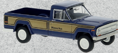
◀ Jeep Gladiator, Honcho, 1968 Nr. v 19812 18,95