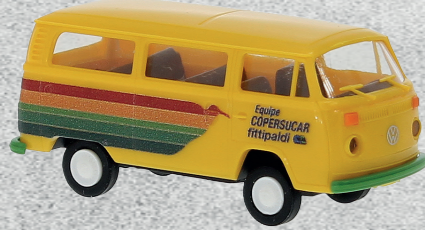
◀ VW T2 Kombi, Copersucar (BRA), 1973 Nr. v 33154 13,95