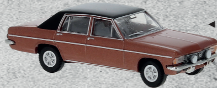
◀ Opel Diplomat Nr. v 20719 14,95