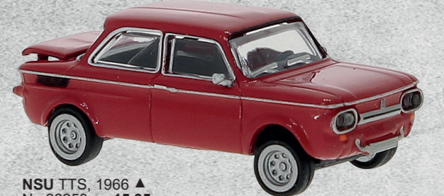
NSU TTS, 1966 ▲ Nr. 28250 15,95