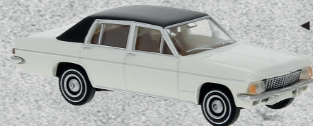
◀ Opel Admiral, 1969 Nr. v 20724 14,95