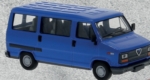
◀ Alfa Romeo AR 6 Bus, 1985 Nr. 34903 17,95