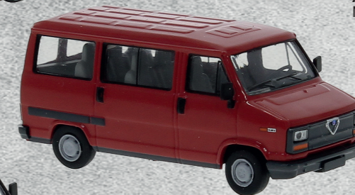
Alfa Romeo AR 6 Bus, 1985 ▶ Nr. 34902 17,95