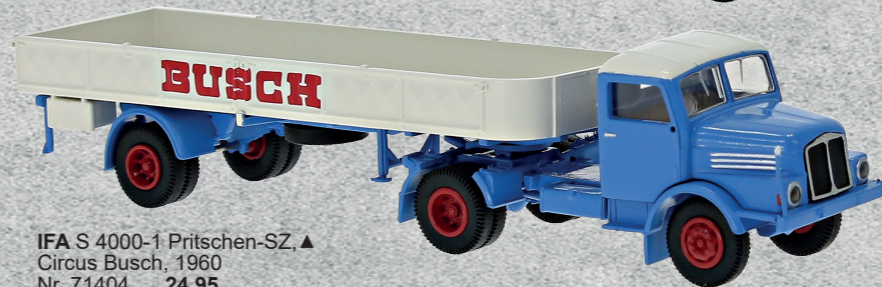
IFA S 4000-1 Pritschen-SZ, ▲ Circus Busch, 1960 Nr. 71404 24.95