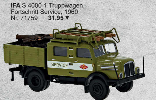
IFA S 4000-1 Truppwagen, Fortschritt Service, 1960 Nr. 71759 31.95 ▼