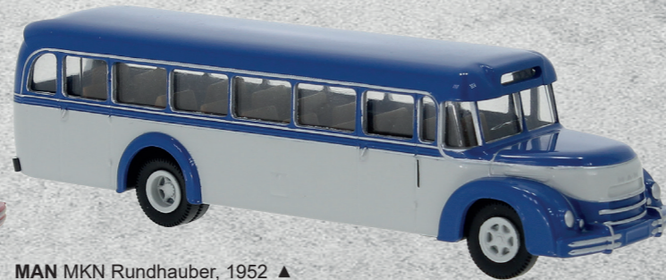
MAN MKN Rundhauber, 1952 ▲ Nr. n 59220 34.95