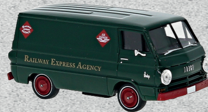
◀ Dodge A 100 Van, REA (USA), 1964 Nr. 34370 15,95