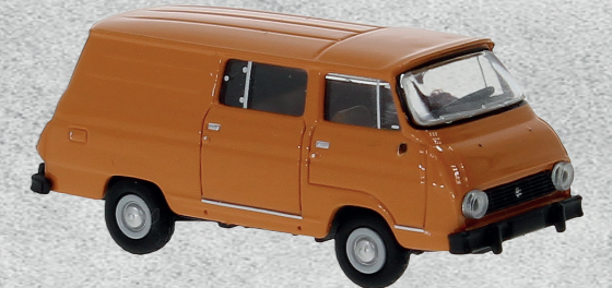
Skoda 1203 Halibus, 1969 Nr. n 30804 16.95 ▼