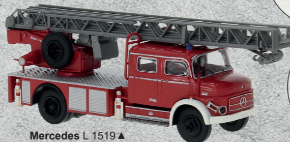
Mercedes L 1519 ▲ DLK 30, 1972 Nr. v 47083 37.95