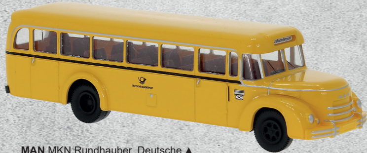
MAN MKN Rundhauber, Deutsche Bundespost, 1952 Nr. n 59222 34.95