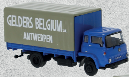
◀ Bedford TK, Gelders Antwerpen, 1960 Nr. v 35905 24,95