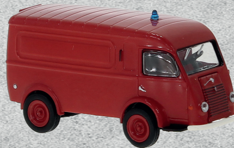
Renault Golette, Sapeurs Pompiers, 1950 Nr. v 14655 16.95