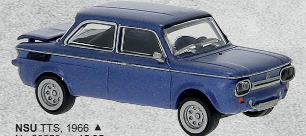
NSU TTS, 1966 ▲ Nr. 28253 15,95