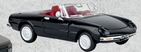
Alfa Romeo Spider Fastback, 1969 ▼ Nr. 29606 16,95