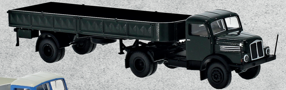
IFA S 4000-1, Pritschen-SZ, 1960 ▶ Nr. 71401 24.95