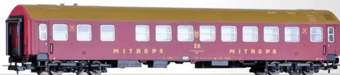
Speisewagen, Typ B, "MITROPA", der DR (Längenmaßstab 1:100) Dining coach, type B, "MITROPA" of the DR (length scale 1:100)