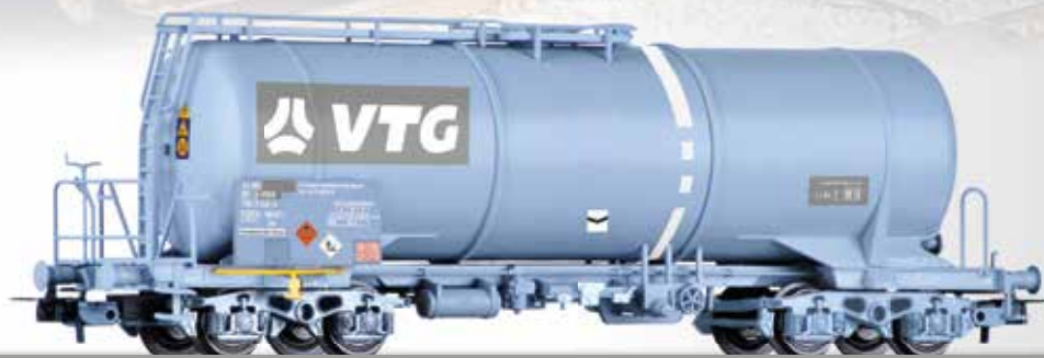
Kesselwagen Zas der VTG Schweiz GmbH Tank car Zas of the VTG Schweiz GmbH