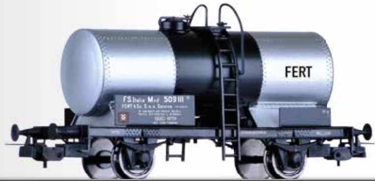
Kesselwagen Mvd "FERT & Co.", eingestellt bei der FS Tank car Mvd "FERT & Co." of the FS