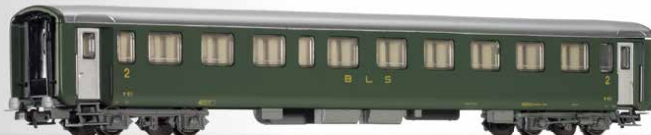
Reisezugwagen 2. Klasse, Bauart Schlieren, der BLS 2nd class passenger coach, type Schlieren, of the BLS