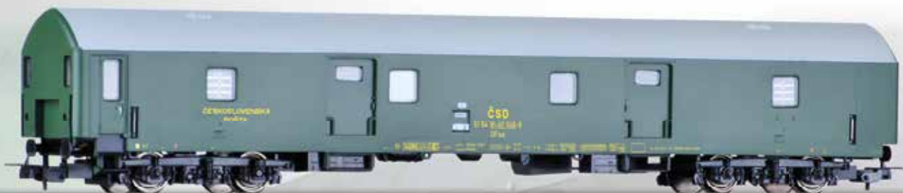
Bahnpostwagen DFsa, Typ Y der ČSD (Längenmaßstab 1:100) Mail waggon DFsa, type Y of the ČSD (length scale 1:100)