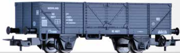
Offener Güterwagen GTAW der NS Open car GTAW of the NS