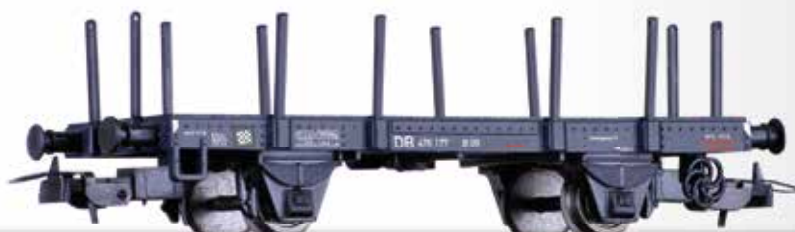
Flachwagen Xf 09 der DB Flat car Xf 09 of the DB