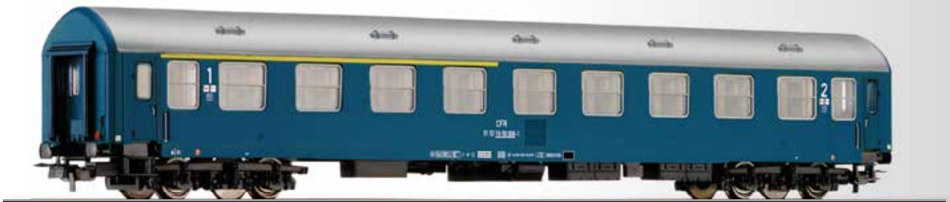
Reisezugwagen 1./2. Klasse, Typ Y/B 70, der CFR 1st/2nd class passenger coach, type Y/B 70, of the CFR • Mit separat angesetzten Griffstangen / separate handrails