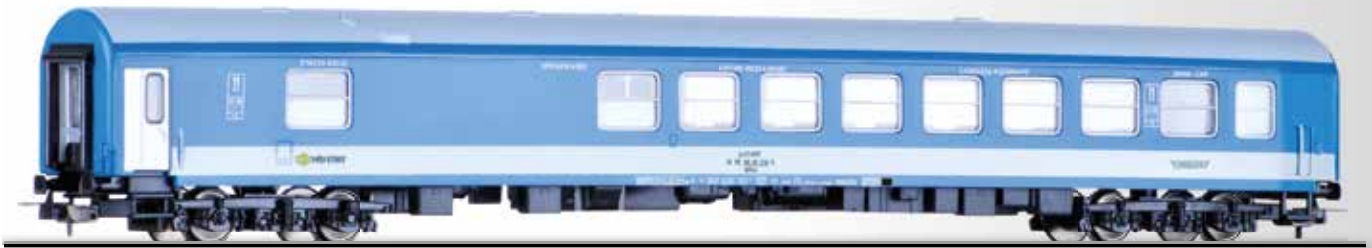
Speisewagen WRm der MAV-START Dining coach WRm of the MAV-START