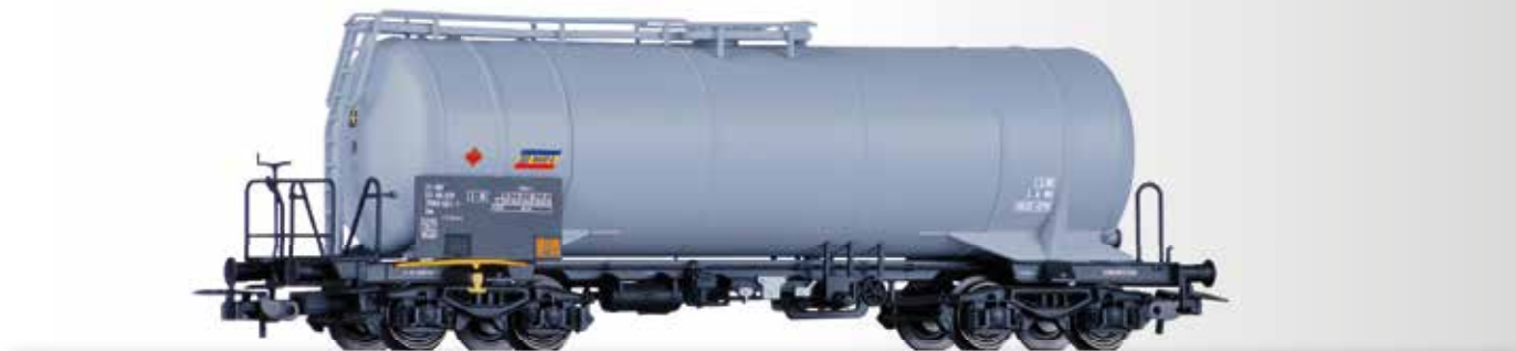
Kesselwagen Zas "MARFA" der CFR Tank car Zas "MARFA" of the CFR