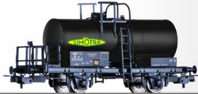
Kesselwagen SCwf "SIMOTRA", eingestellt bei der SNCF Tank car SCwf "SIMOTRA" of the SNCF