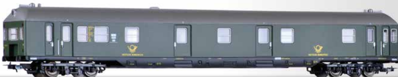
Bahnpostwagen Post 4 mf mit Steuerabteil der Deutschen Bundespost Mail waggon Post 4 mf with driving cap of the Deutschen Bundespost