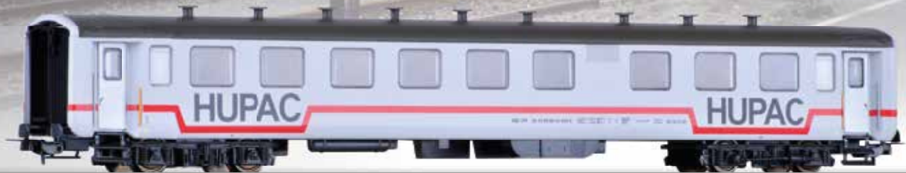
RoLa-Begleitwagen HUPAC, Bauart Schlieren, der SBB RoLa caboose HUPAC, type Schlieren, of the SBB