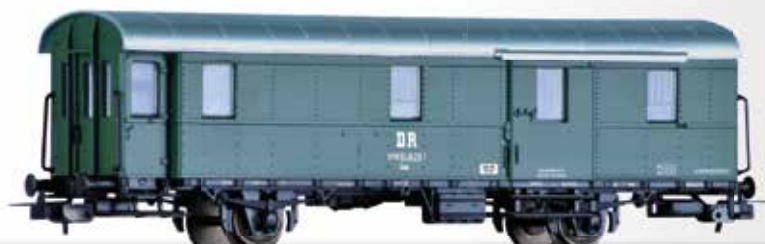
Packwagen (ex. Pwi-31a) der DR Baggage car (ex. Pwi-31a) of the DR