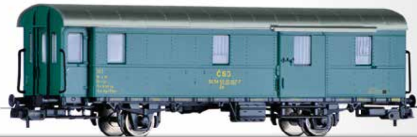
Packwagen Dd (ex. Pwi-31a) der ČSD Baggage car Dd (ex. Pwi-31a) of the ČSD