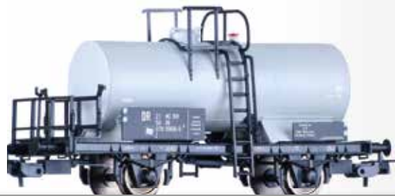
Kesselwagen Z "VEB Chemische Werke Buna", eingestellt bei der DR Tank car Z "VEB Chemische Werke Buna" of the DR