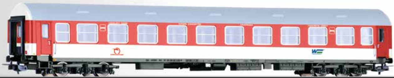
Reisezugwagen 2. Klasse, Typ Y/B 70, der ZSSK 2nd class passenger coach, type Y/B 70, of the ZSSK