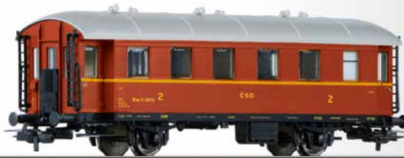
Beiwagen 2. Klasse Bim (ex. Ci-33) der ČSD 2nd class trailer car Bim (ex. Ci-33) of the ČSD