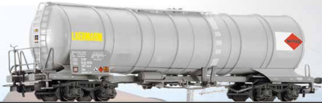
Kesselwagen Zans der MITRAG AG Tank car Zans of the MITRAG AG