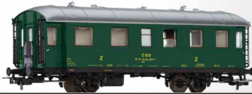
Nebenbahn-Personenwagen 2. Klasse Be (ex. BČi-34) der ČSD 2nd class passenger coach Be (ex. BČi-34) of the ČSD