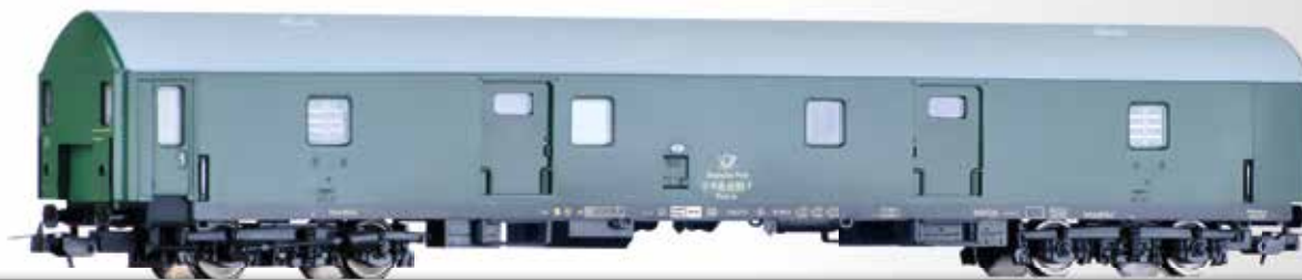
Bahnpostwagen, Typ Y, der Deutschen Post (Längenmaßstab 1:100) Mail wagon, type Y, of the Deutschen Post (length scale 1:100)