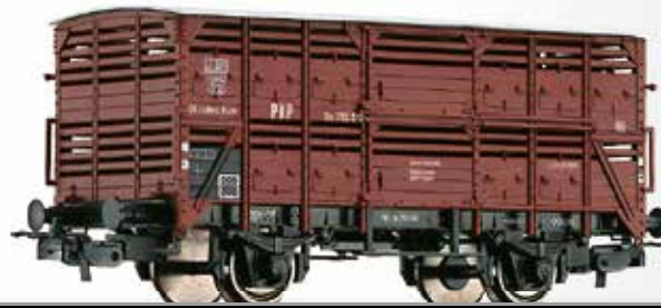
Verschlagwagen Sn der PKP Shed car Sn for transport of animals of the PKP