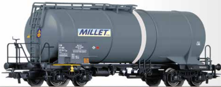
Kesselwagen Zas der MILLET S.A.S. Tank car Zas of the MILLET S.A.S.