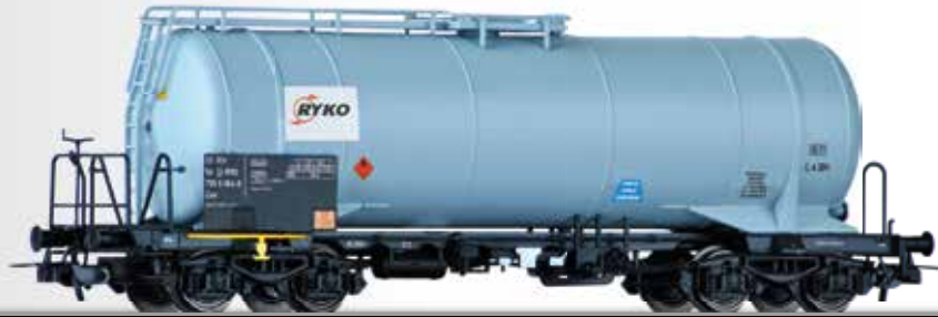
Kesselwagen Zas der RYKO PLUS s.r.o. Tank car Zas of the RYKO PLUS s.r.o.