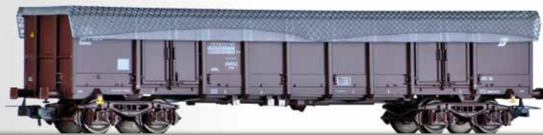
Offener Güterwagen Eanos der ÖBB, mit Ladungssicherung Open car Eanos of the ÖBB with tarpaulin