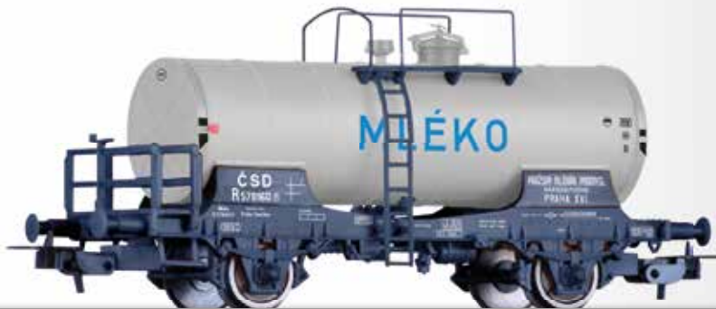
FORMNEUHEIT: Kesselwagen R "MLÉKO" der ČSD NEW: Tank car R "MLÉKO" of the ČSD