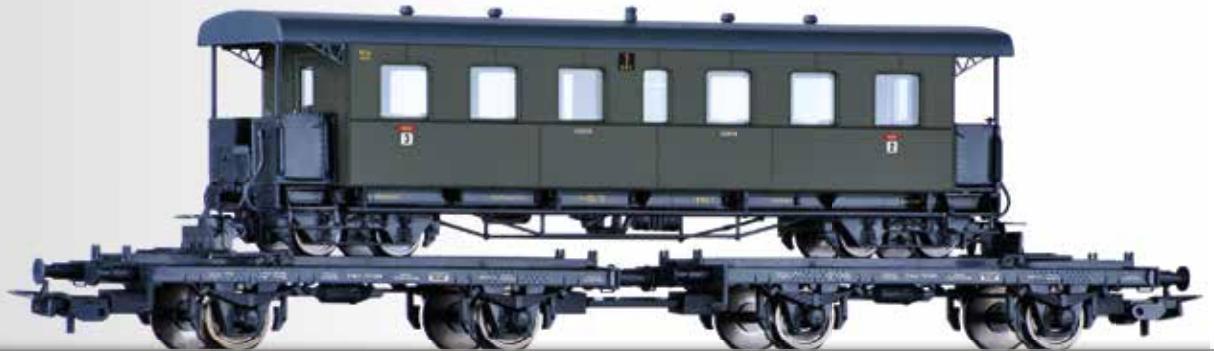
Set „Schmalspurtransport“ der DRG, zwei Schmalspur-Transportwagen H0, beladen mit einem Schmalspur-Personenwagen der NWE H0m Narrow gauge set of the DRG with two transport cars H0, loaded with one narrow gauge passenger coach of the NWE H0m