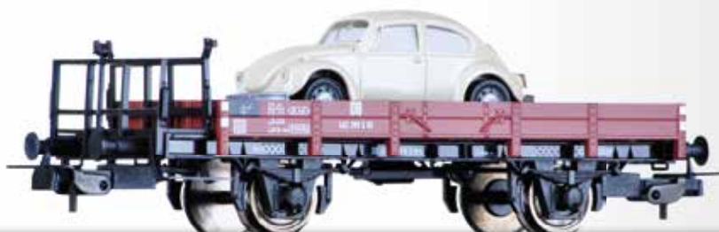
Niederbordwagen X05 (X Erfurt) der DB, beladen mit PKW Low side car X05 (X Erfurt) of the DB, loaded with car