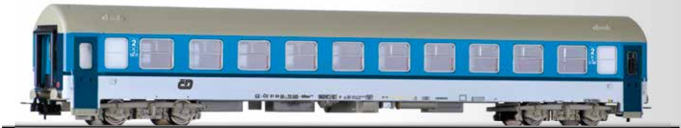
Reisezugwagen 2. Klasse Bee der ČD 2nd class passenger coach Bee of the ČD