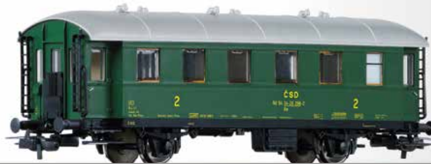
Nebenbahn-Personenwagen 2. Klasse Be (ex. BČi-33) der ČSD 2nd class passenger coach Be (ex. BČi-33) of the ČSD