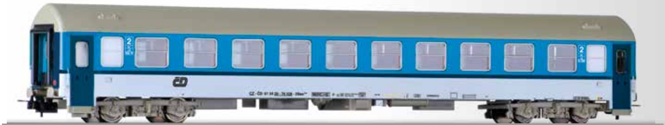
Reisezugwagen 2. Klasse Bee der ČD, 2. Betriebsnummer 2nd class passenger coach Bee of the ČD, 2nd operation number