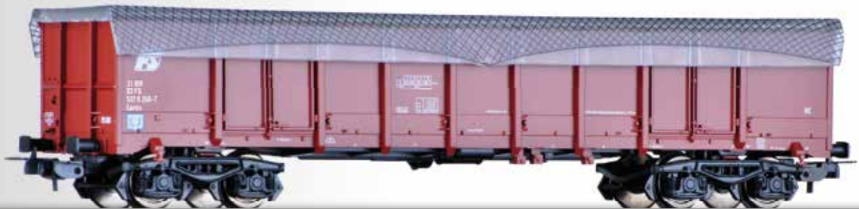
Offener Güterwagen Eanos der FS, mit Ladungssicherung Open car Eanos of the FS with tarpaulin