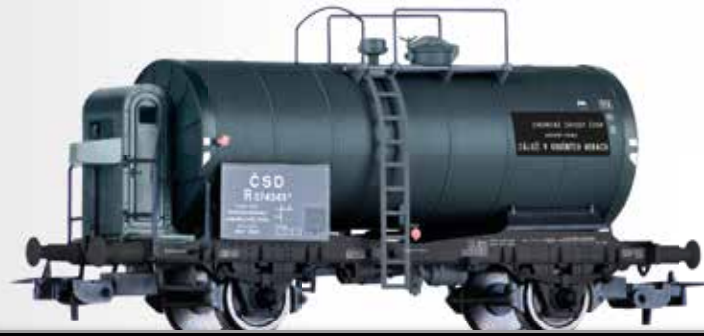
FORMNEUHEIT: Kesselwagen R der ČSD NEW: Tank car R of the ČSD