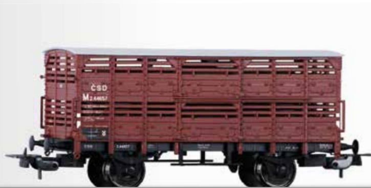
Verschlagwagen M der ČSD Shed car M for transport of animals of the ČSD