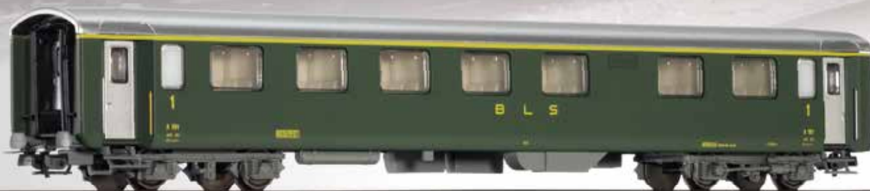
Reisezugwagen 1. Klasse, Bauart Schlieren, der BLS 1st class passenger coach, type Schlieren, of the BLS