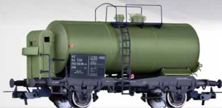
FORMNEUHEIT: Kesselwagen Zek der ČSD NEW: Tank car Zek of the ČSD