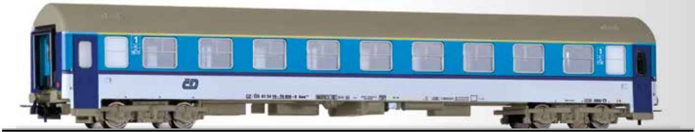
Reisezugwagen 1. Klasse Aee der ČD 1st class passenger coach Aee of the ČD