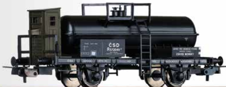
Säurekesselwagen R der ČSD Acid tank car R of the ČSD