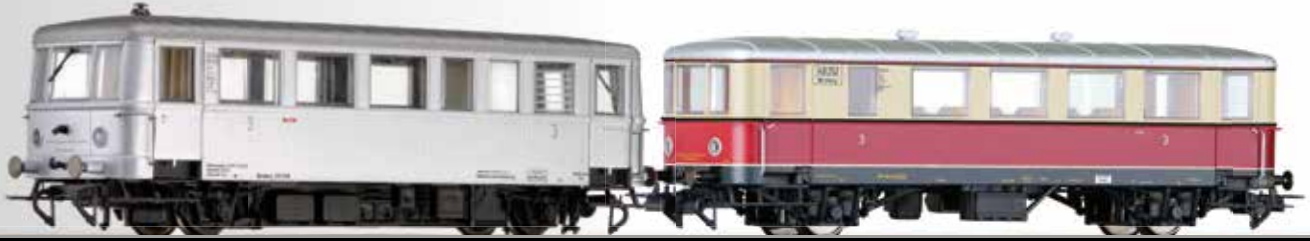
Triebwagen CvT 135 (Hydronalium) mit Beiwagen CPost v-35 der DRG Railbus class CvT 135 with trailer car CPost v-35 of the DRG