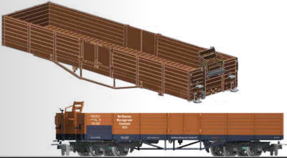
Offener Güterwagen Oml der NWE (H0m) Open car Oml of the NWE (H0m)