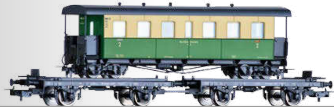
Set „Schmalspurtransport“ der DB, bestehend aus zwei Transportwagen H0 beladen mit einem H0e Personenwagen der NKB Set "Narrow gauge transport" of the DB with two transport cars H0 loaded with one narrow gauge passenger coach H0e of the NKB