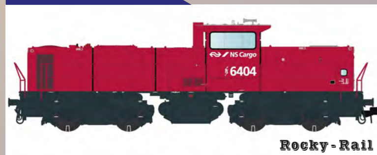
Rocky - Rail