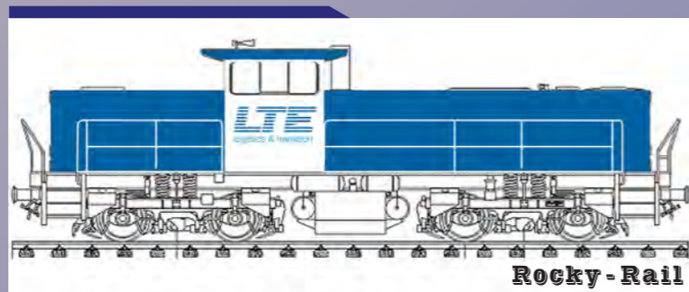
Rocky - Rail