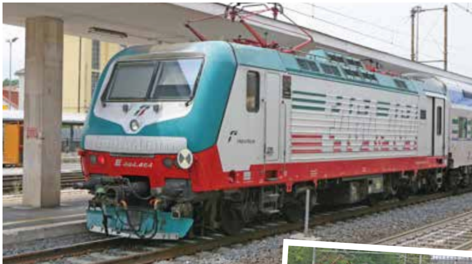
E 464.464 di Trenitalia Epoca VI (91 83 2464 464-3 I-TI).