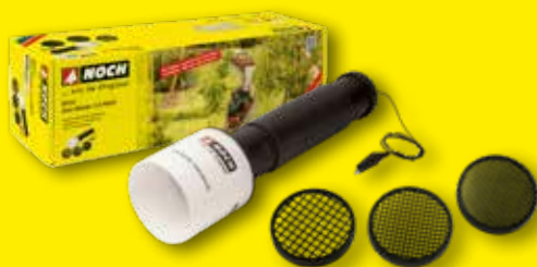
NOCH Gras-Master 3.0