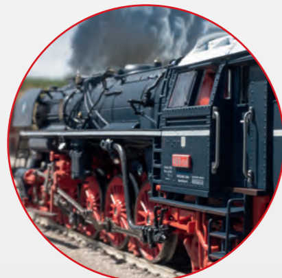
Geregelter Hochleistungsantrieb mit Schwunghasse im Kessel, vier Achsen angetrieben.

This model can be found in a DC version in the Trix H0 assortment under item number 25498.