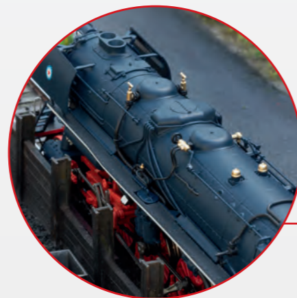
Filigrane Metallkonstruktion, viele Details angesetzt. Intricate metal construction, many separately applied details.

Controlled high-efficiency propulsion with a flywheel, mounted in the boiler, 4 axles powered.