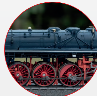
Freier Fahrwerksdurchblick. Open view through the running gear.