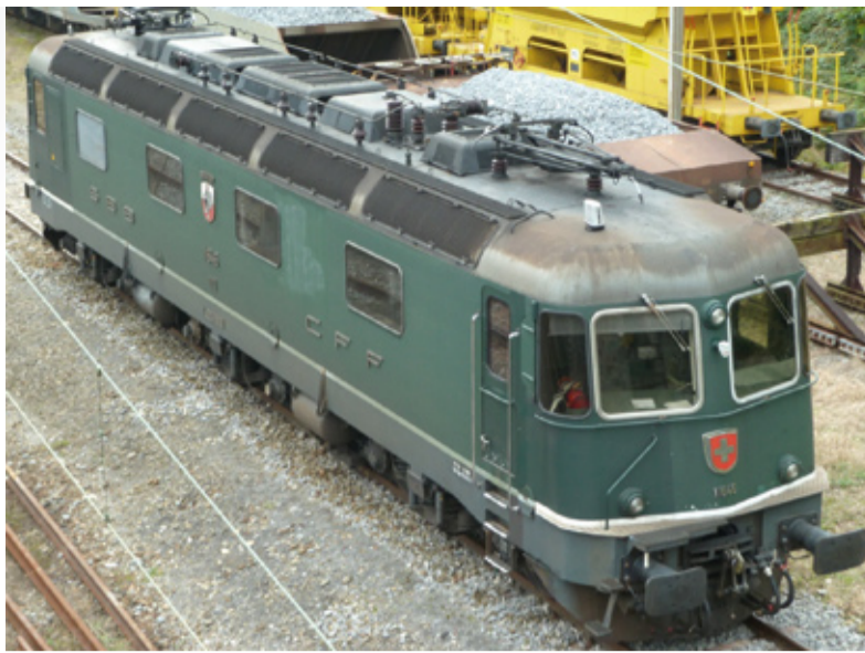
I-208/4 B & O-202/4 B