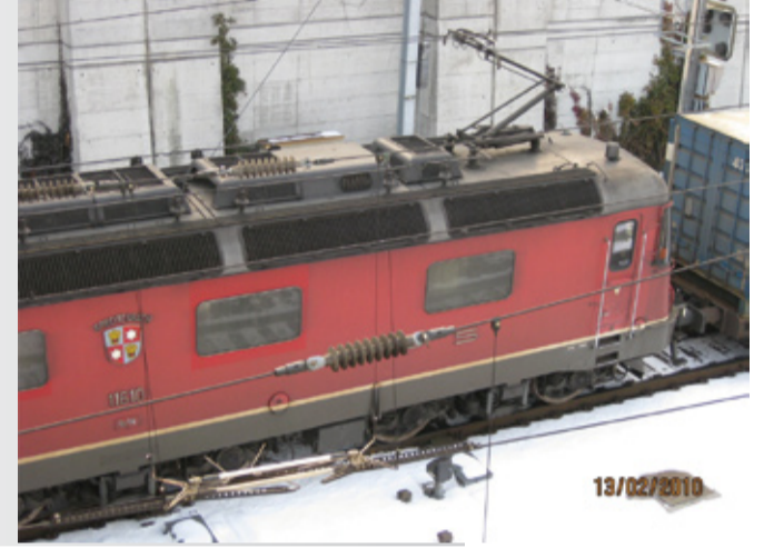
I-208/5 A & O-202/5 A