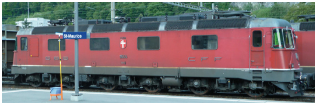
SBB Re 6/6 11603 „Wädenswil“ , eckige Scheinwerfer, UIC-Steckdose und Treppe, ZUB, Klima, rot, 2000-er Jahre