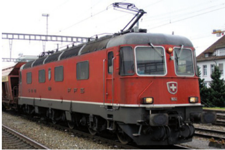
I-208/4 C & O-202/4 C