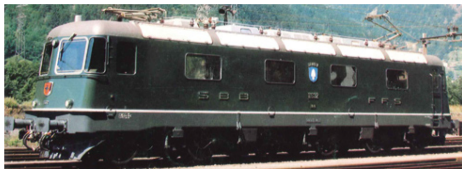
SBB Re 6/6 11647 „Bex“ , Auslieferungszustand, grün, 1972-1990-er Jahre