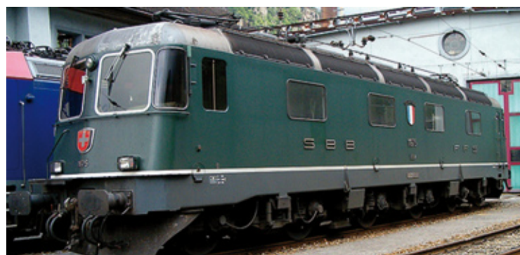
SBB Re 6/6 11683 „Amsteg-Silenen“ , eckige Scheinwerfer, UIC-Steckdose und Treppe, ZUB, grün, 1990-er Jahre