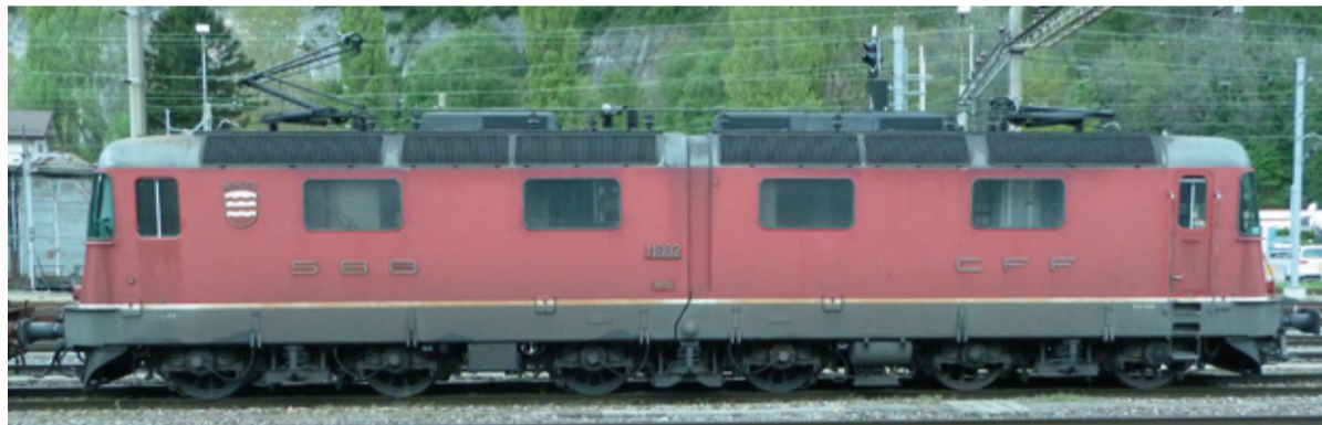
SBB Re 6/6 11602 „Morges“ , eckige Scheinwerfer, UIC-Steckdose und Treppe, ZUB, rot, 1990-er Jahre