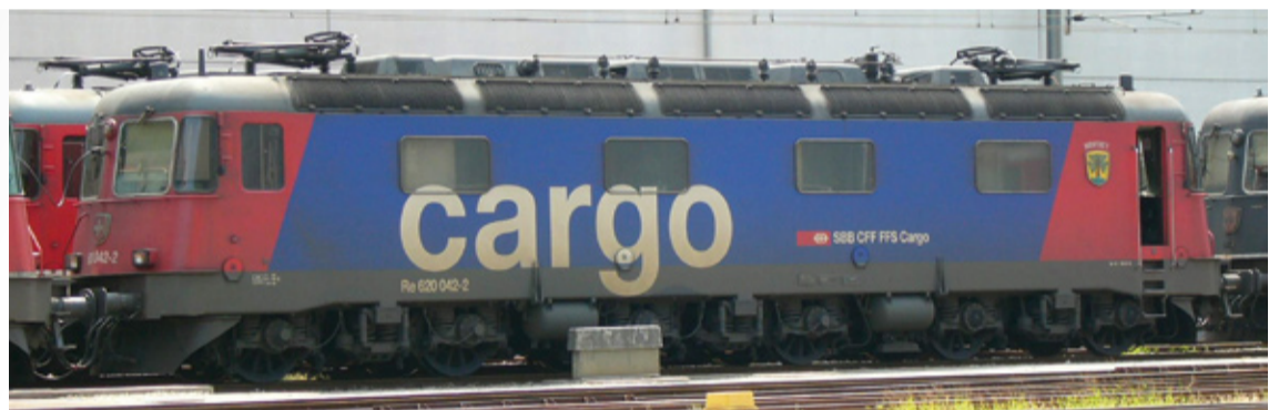
I-208/5 B & O-202/5 B