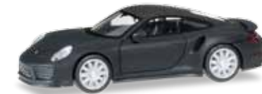
Ab Dezember 2016 lieferbar! Delivery in December 2016! 1/87

038713 Porsche 911 Turbo, mattschwarz mit Chromfelgen In der Herpa-Manufaktur aufwändig mit mattem Lack überzogen, ergänzt auch der Porsche die erfolgreiche Serie der mattschwarzen Tuningfahrzeuge. Ein weiteres Highlight sind die verchromten Felgen. / Elaborately covered with matt varnish in the Herpa factory, the Porsche now also enhances the series of matt black tuning vehicles. Another highlight is the chromed rims featured on the model.