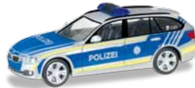
Ab November 2016 lieferbar! Delivery in November 2016! 1/87

092746 BMW 3er Touring „Polizei Bayern“ In einer Präsentation am 15. September wurde auch für die bayerische Polizei das neue Farbschema silber/blau vorgestellt. Zu diesem Anlass hat Herpa das erste Fahrzeug mit diesen Farben aus Bayern realisiert. / In a presentation on September 15, 2016, the new color design silver/blue was also introduced for the Bavarian police. For that occasion, Herpa released the first Bavarian vehicle with these colors.