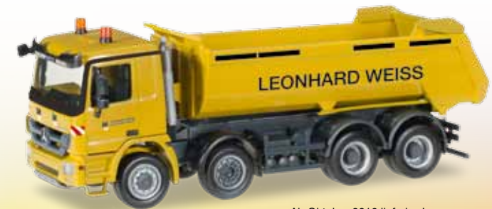
Ab Oktober 2016 lieferbar! Delivery in October 2016! 1/87

306362 Mercedes-Benz Actros L `08 4-achs Rundmulden-LKW / Mercedes-Benz Actros L `08 4-axe dump truck „Leonhard Weiss“