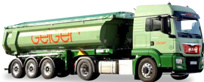
Ab März 2017 lieferbar! Delivery in March 2017! 1/50 179,95 €