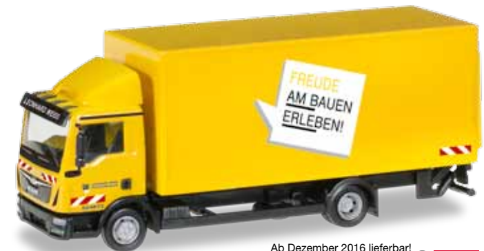
Ab Dezember 2016 lieferbar! Delivery in December 2016! 1/87

The construction vehicle series of the worldwide operating construction company Leonhard Weiss is continued with three models. Next to an MAN flatbed semitrailer and a Mercedes-Benz Actros `08 with trough, we also release a MAN TGL Koffer-LKW box truck featuring the company design. Further models were already announced for regional retailers in Baden-Württemberg.