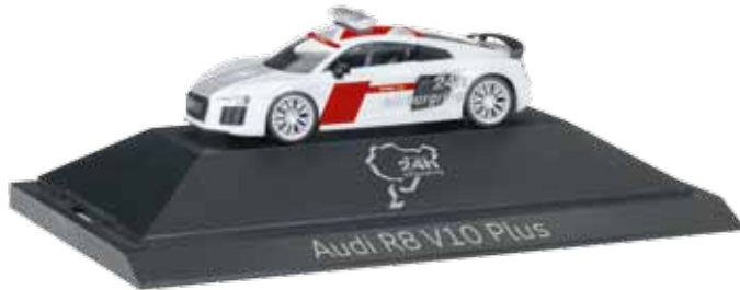
Ab November 2016 lieferbar! Delivery in November 2016! 1/87

102001 Audi R8 V10 plus Safety Car „24h Nürburgring“ Nach der Umsetzung des Audi R8 Safetycar der ADAC GT Masters folgt nun die Variante im Design des legendären „24 h Nürburgring“. Auch dieses Modell wird in der bekannten Vitrinenverpackung ausgeliefert. / After the Audi R8 safety car of the ADAC GT Masters the variant of the legendary „24 h Nürburgring“ follows. This model is delivered in the well-known display box as well.