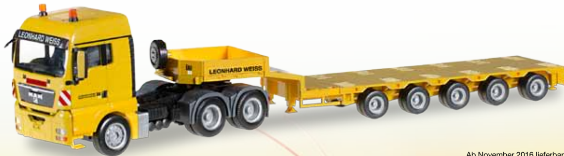
Ab November 2016 lieferbar! Delivery in November 2016! 1/87

306379 MAN TGX XLX Semitiefblade-Sattelzug / MAN TGX XLX low boy semitrailer „Leonhard Weiss“ (3a/5a)