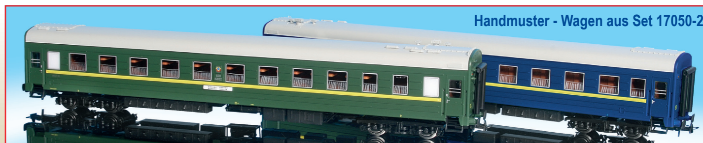
Handmuster - Wagen aus Set 17050-2

Viele Freunde Russischer Wagen haben Heris gebeten, für die Soldatenzüge in der DDR den Wagentyp 909 Ad, in Polen gebaut, zu realisieren. Dieser Wagen wird nun unter der Artikelnummer 17058 angeboten. Parallel wird unter der Artikelnummer 17065 ein in Russland gebauter Platzkart-Wagen angeboten werden, der dem Typ Kalinin PN entspricht. So entsteht noch mehr Abwechslung in dem Angebot von Breitspurwagen bei HERIS.