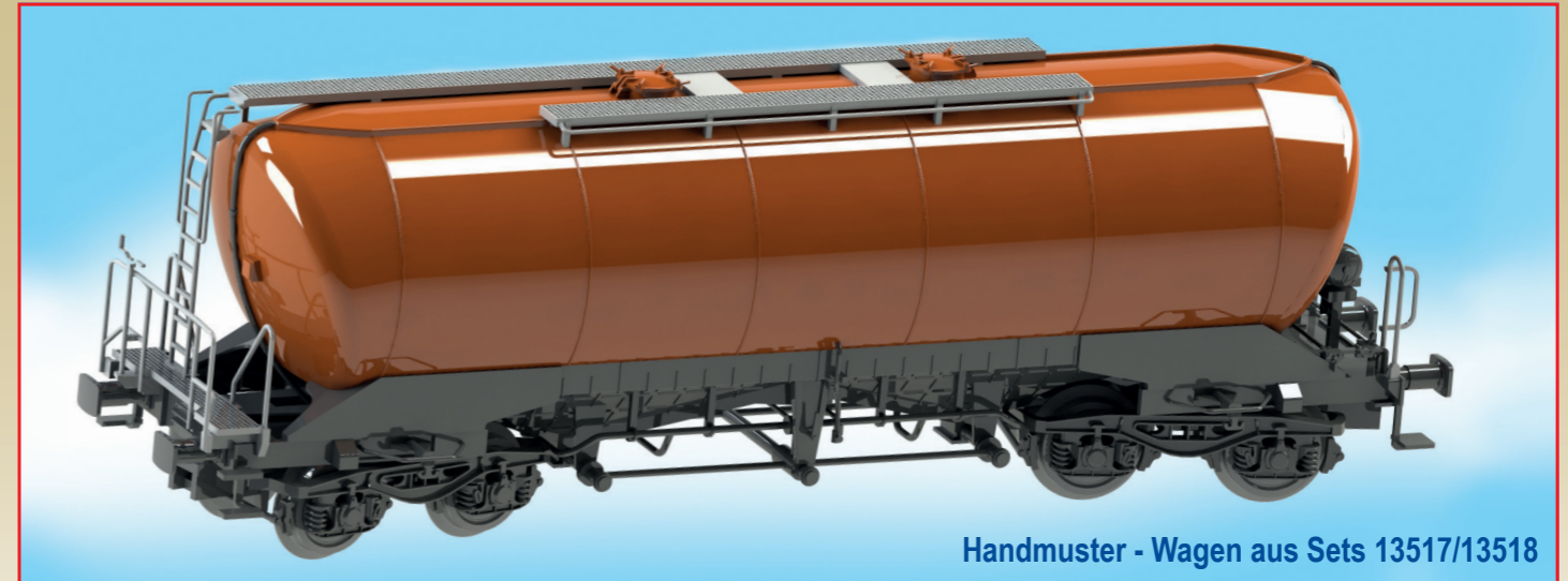
Handmuster - Wagen aus Sets 13517/13518