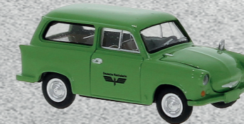
Trabant P 50 Kombi, Deutsche Reichsbahn, 1960 Nr. v 27561 14.95 ▶