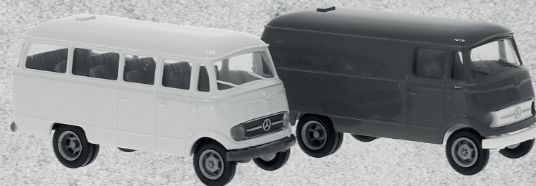
Sortiment zum ▲ Bau zweier MB L/O 319, 1960 Nr. 10212 17.95