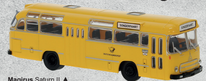
Magirus Saturn II, ▲ Deutsche Bundespost, 1960 Nr. v 59528 34.95