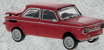
NSU TTS, 1966 ▲ Nr. 28250 15.95