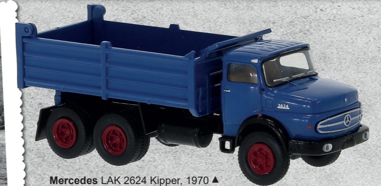
Mercedes LAK 2624 Kipper, 1970 ▲ Nr. n 81150 27.95