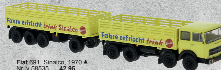
Fiat 691, Sinalco, 1970 ▲ Nr. v 58535 42.95