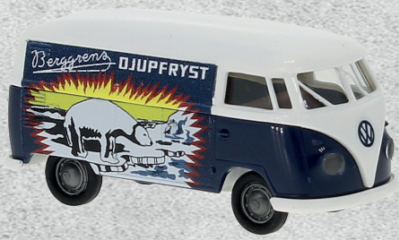
VW T1b Kasten, ▲ Berggrens Djupfryst, 1960 Nr. v 32738 14.95