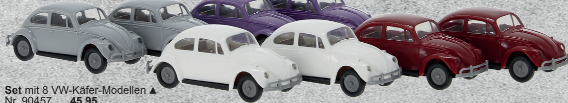
Set mit 8 VW-Käfer-Modellen ▲ Nr. 90457 45.95