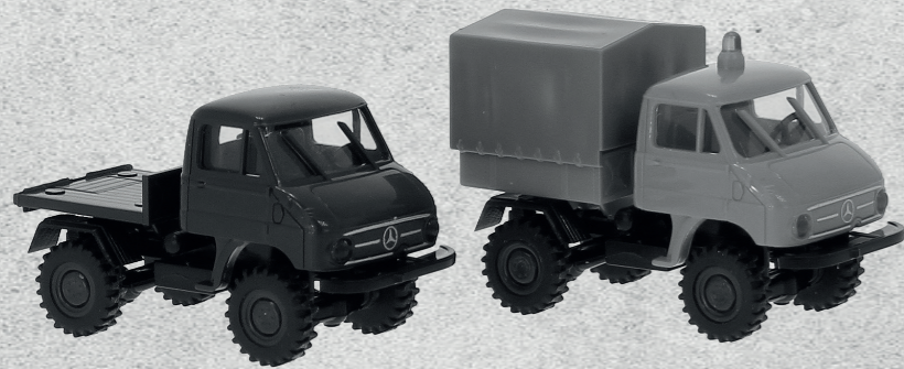
Sortiment zum ▲ Bau zweier MB Unimog 411, 1955 Nr. v 10217 17.95