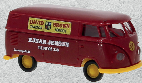
VW T1b Kasten, ▲ David Brown Traktor Service, 1960 Nr. v 32747 12.95