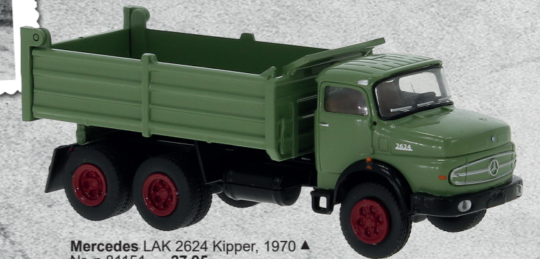
Mercedes LAK 2624 Kipper, 1970 ▲ Nr. n 81151 27.95