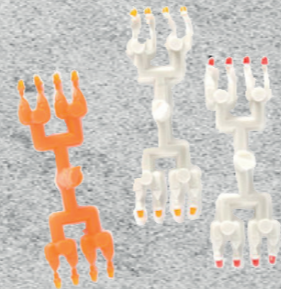
Set mit 24 gelben, ▲ oranjen und roten Signalleuchten Nr. v 10076 3.95