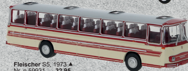
Fleischer S5, 1973 ▲ Nr. n 59931 32.95