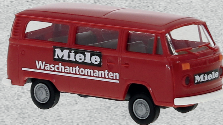
◀ VW T2 Kombi, Miele, 1973 Nr. 33151 13.95