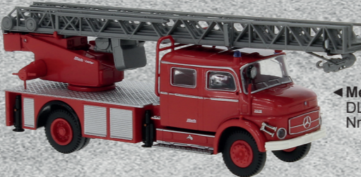
◀ Mercedes L 1519 DLK 30, 1972 Nr. v 47082 37.95