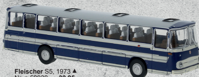
Fleischer S5, 1973 ▲ Nr. n 59930 32.95