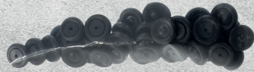
Set mit 40 Oldtimer-Rädern ▲ Nr. v 10072 4.95