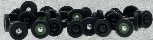
Set mit 16 Radsätzen ▲ (Räder und Achsen für 4 Fahrzeuge) Nr. v 10073 5.95