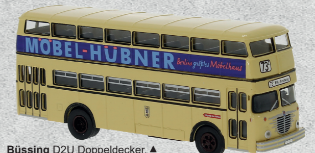
Büssing D2U Doppeldecker, ▲ BVG - Möbel Hübner, 1960 Nr. v 61253 34.95

Letzte Chance: Abverkauf der Ersatzteile für BREKINA-Eisenbahnfahrzeuge: