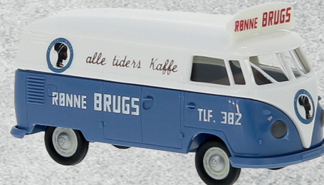
VW T1b Kasten, ▲ Ronne Brugs - Cirkel Kaffe, 1960 Nr. v 32742 17.95