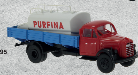
◀ Borgward B 4500 Pritsche, Purfina, 1952 Nr. v 43030 17.95