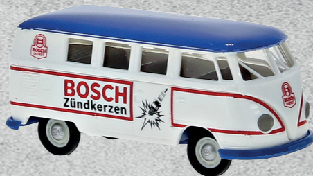
VW T1b Kombi, Bosch Zündkerzen, 1960 Nr. 31606 14.95 ▶