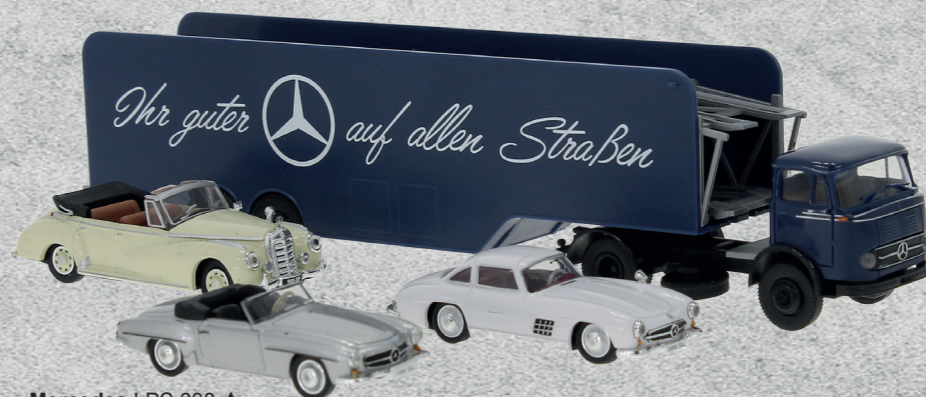
Mercedes LPS 338 ▲ Autotransport-SZ, Mercedes-Benz, mit 3 Rikko-Modelle, 1960 Nr. v 48044 49.95