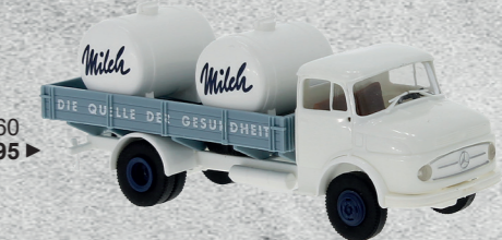
Mercedes L 322 Pritsche, Milch, 1960 Nr. v 47042 17.95 ▶