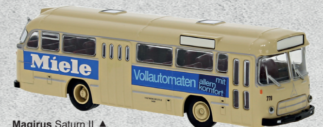
Magirus Saturn II, ▲ "Miele" aus Bielefeld, 1960 Nr. 59521 32.95