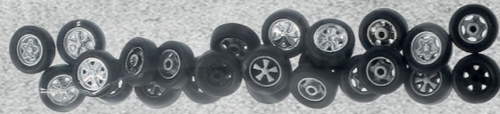
Set mit 24 Rädern ▲ für Porsche 911 Nr. v 10071 9.95