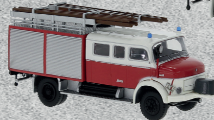
◀ Mercedes LAF 1113 LF 16, Feuerwehr Hessen, mit Vorbaupumpe, 1972 Nr. v 47139 35.95