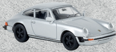
Porsche 911 G, TD, 1976 ▲ Nr. 16320 14.95