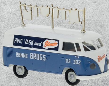
VW T1b Kasten, ▲ Ronne Brugs - Blenda, 1960 Nr. v 32743 19.95