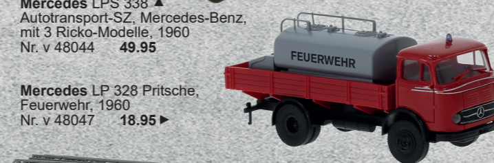
Mercedes LP 328 Pritsche, Feuerwehr, 1960 Nr. v 48047 18.95 ▶