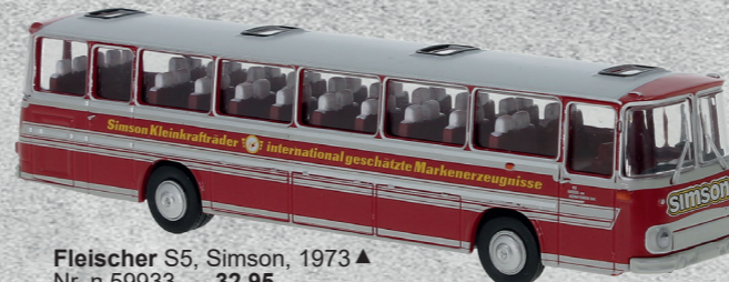
Fleischer S5, Simson, 1973 ▲ Nr. n 59933 32.95