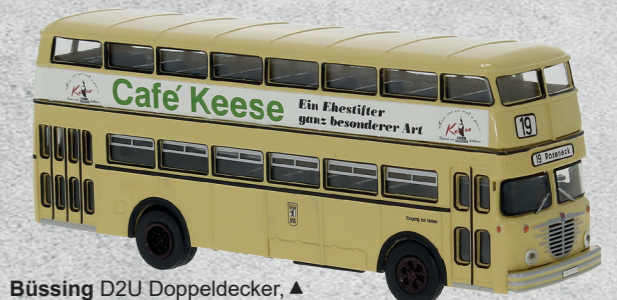
Büssing D2U Doppeldecker, ▲ BVG - Cafe Keese, 1960 Nr. v 61252 34.95