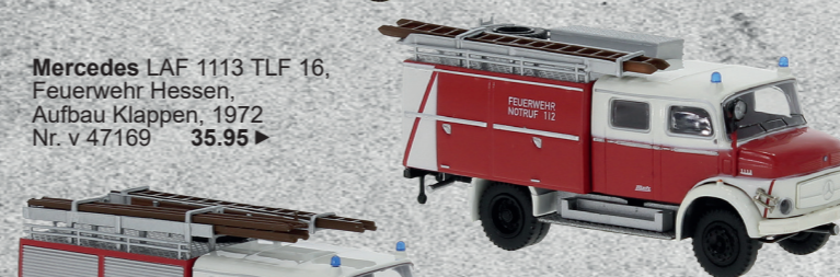
Mercedes LAF 1113 TLF 16, Feuerwehr Hessen, Aufbau Klappen, 1972 Nr. v 47169 35.95 ▶