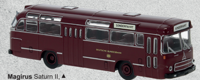
Magirus Saturn II, ▲ Deutsche Bundesbahn, 1960 Nr. 59526 34.95