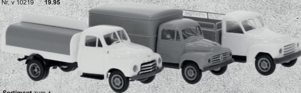
Sortiment zum ▲ Bau dreier Leichtlastwagen, 1955 Nr. 10213 24.95