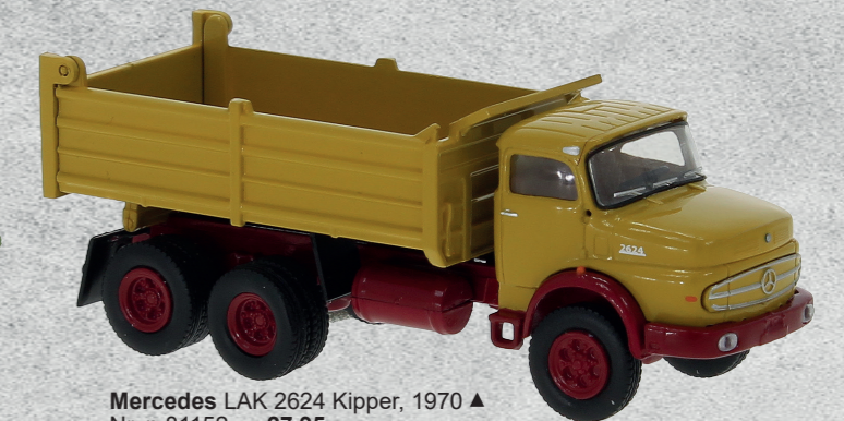
Mercedes LAK 2624 Kipper, 1970 ▲ Nr. n 81152 27.95