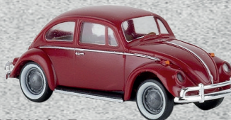
VW Käfer Export ▲ Nr. 25044 12.95