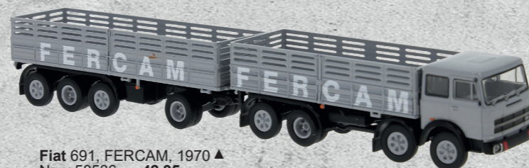
Fiat 691, FERCAM, 1970 ▲ Nr. v 58536 42.95