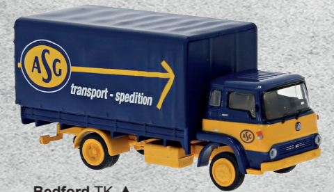
Bedford TK, ▲ ASG, 1971 Nr. 35903 24.95