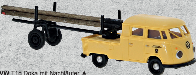
VW T1b Doka mit Nachläufer, ▲ Österreichische Post, 1960 Nr. 32836 29.95