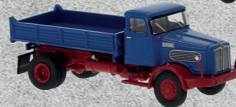
◀ Büssing Commodore SAK Kipper, 1963 Nr. v 79250 27.95