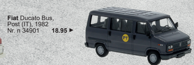
Fiat Ducato Bus, Post (IT), 1982 Nr. n 34901 18.95 ▶