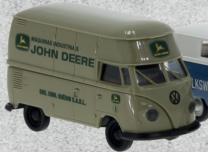
Set mit 3 VW ▲ Bulli aus Südamerika, 1960 Nr. v 90494 49.95