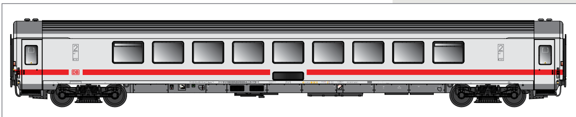
Carrozza Bpmz 857.1 in livrea ICE con mantici SIG Bpmz 857.1 car, DB ICE livery, with SIG intercom. Bpmz 857.1 Wagen, DB ICE Lackierung, mit SIG Faltenbalg.